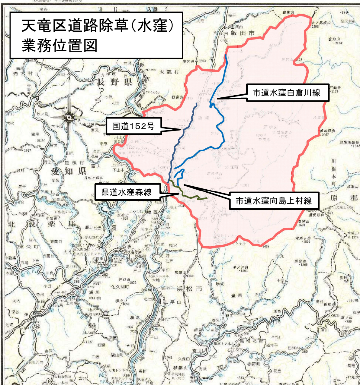
道路除草業務 路線別数量明細表