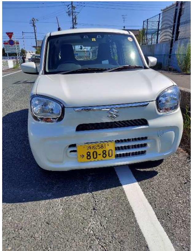
公用車は被害なしです。