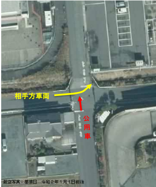
事故現場（交差点）状況