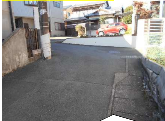
事故現場全景(塵芥車無し)