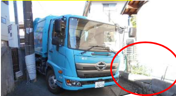
事故現場全景(南側から撮影)