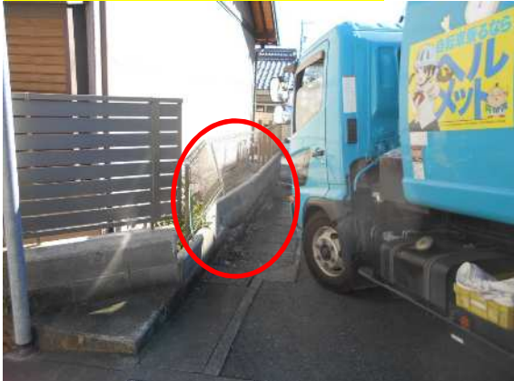
事故現場全景(北側から撮影)