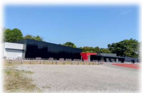
旧ドラマ館・旧オフィス棟