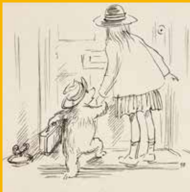
ベギー・フォートナム画 「くまのパディントン」の挿絵原画、1958年