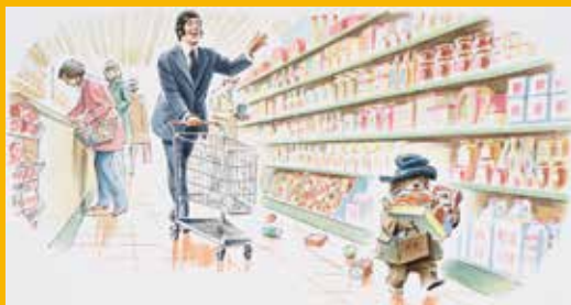
フレッド・バンベリー画 絵本「パディントンのかいもの」の原画、1973年

イギリスを代表する児童文学「パディントン」シリーズは、1958年、作家マイケル・ボンドによって誕生しました。その後、40以上の言語に翻訳・出版されるとともに、絵本・アニメ・映画やぬいぐるみなど幅広い分野で展開され、世界中で愛され続けています。