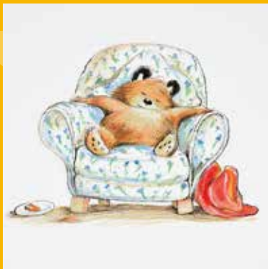
R.W. アリー画 絵本「くまのパディントン」の原画、2007年