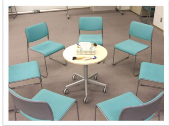
椅子を丸く並べて語り合いを行っています。